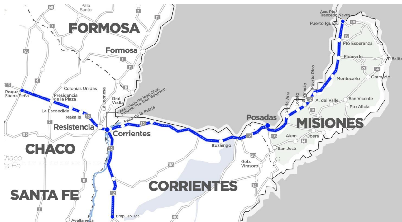
Imagen 1 – Tramo III de Corredores Viales

La obra se ubica en la Ruta Nacional N° 12 desde Km. 871,15 hasta Km. 1641,52, sobre la extensión concesionada integrante del Tramo III de la red de Corredores Viales concesionados por Vialidad Nacional, en las Provincias de Corrientes y Misiones.